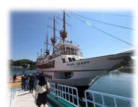
九十九島水族館 遊覧船