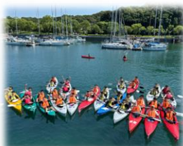
九十九島カヤック体験