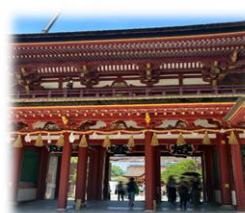
大宰府天満宮 学問の神に祈禱