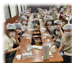
はねや めんたいこ作り