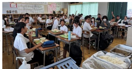
給食の時間！ 放送部が昼の放送を行います。 音楽をリクエストしよう！