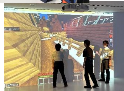
5・6限目は共創！ 今年度は、61のプロジェクト が活動しました。