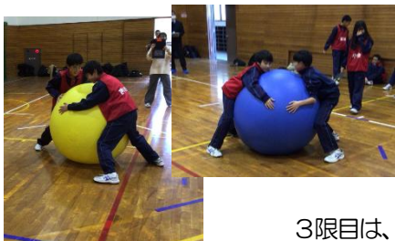
3限目は、体育（男女共修）！ 生徒が考えたルールで「シンSUMO（相撲）」を実施