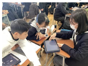
4限目は、数学！ゲーム 感覚で確率について学ぶ