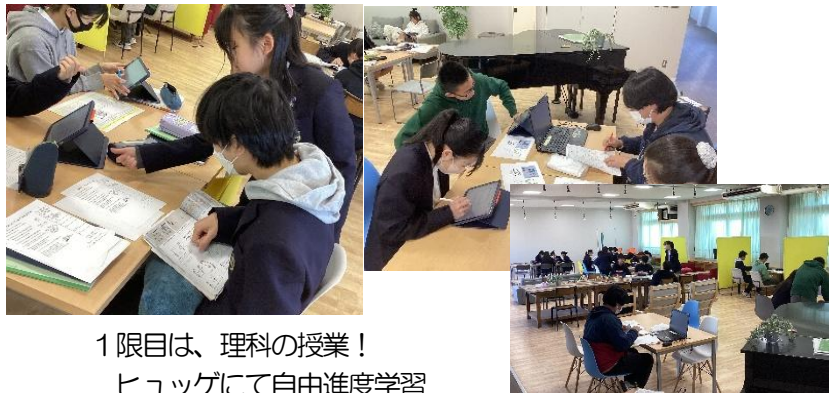
1限目は、理科の授業！ ヒュッグにて自由進度学習