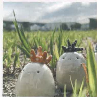
在学時の陶芸作品「種族名 とろとろろ」