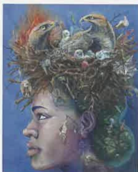
在学時の絵画作品「代償」