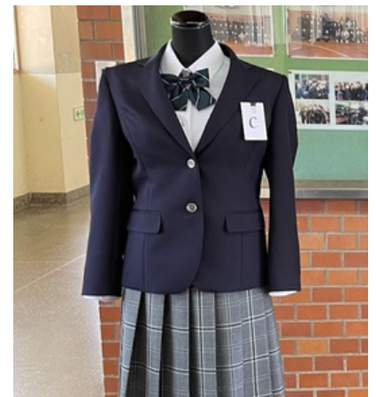
↑制服会社のオリジナル製品 (ブレザー&スカート&リボン)

その後、ルールメイカー内で議論を重ねたところ、派手な色を明確に分けることは出来ないことや多様性を大切にする小津中学校としては、人によって落ち着く色や好きな色は異なり、「特定の色を禁止するようなルールはあえて設定するべきではない」という考えにまとまり、色の制限は行わないという結論となりました。